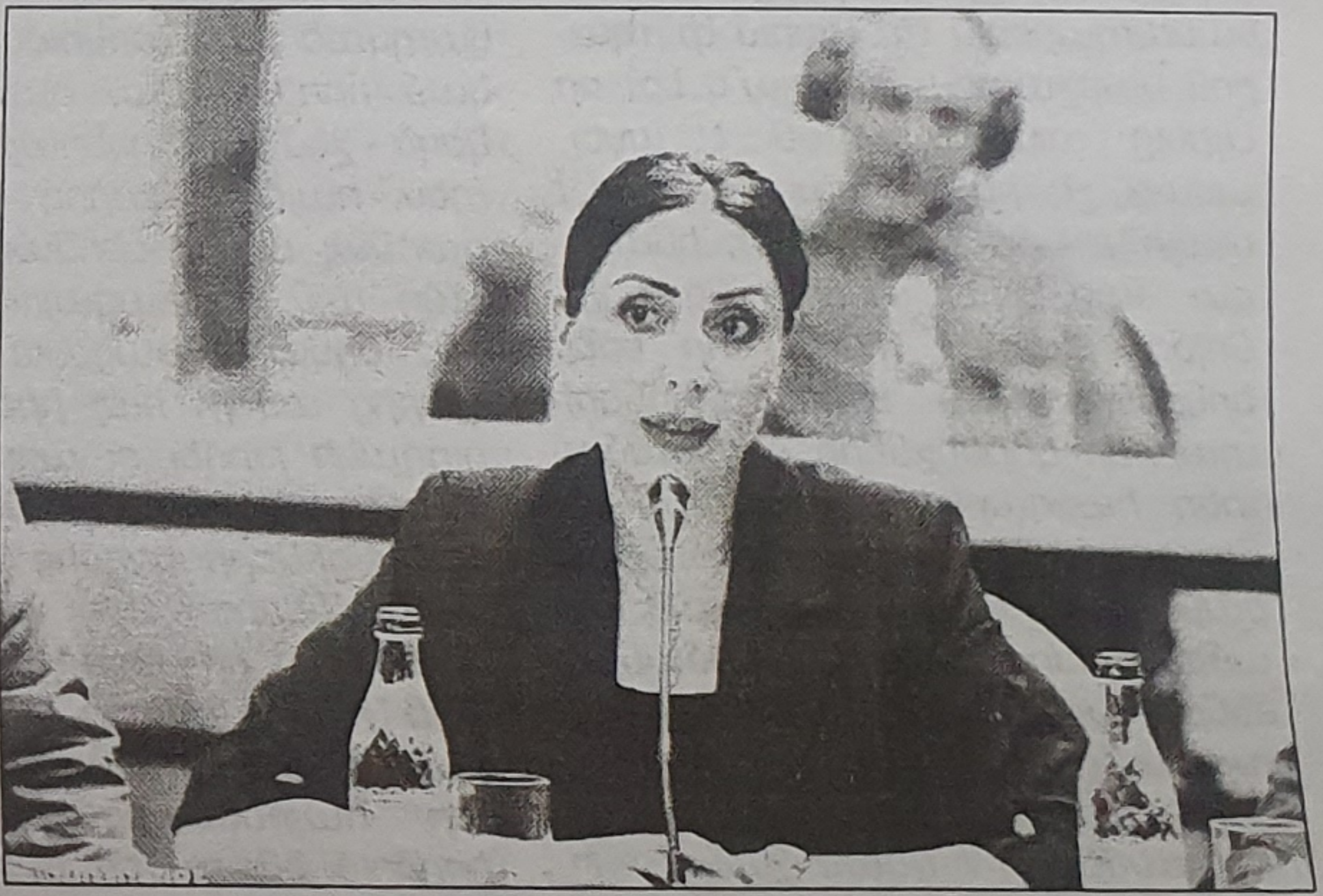
Ռ. ՀՈՎՀԱՆՆԻՍՅԱՆ Կարդացեք նաեւ՝ էջ 4: